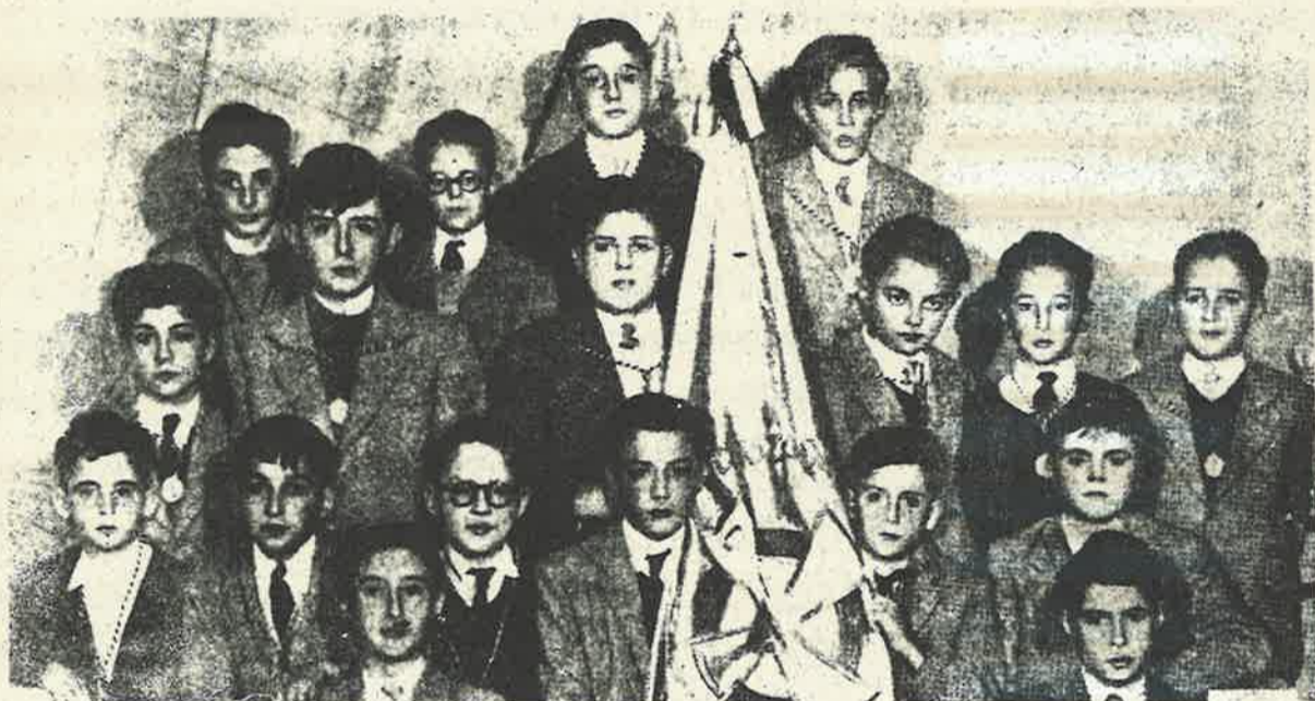
JUNTA DE LA CRUZADA EUCARISTICA