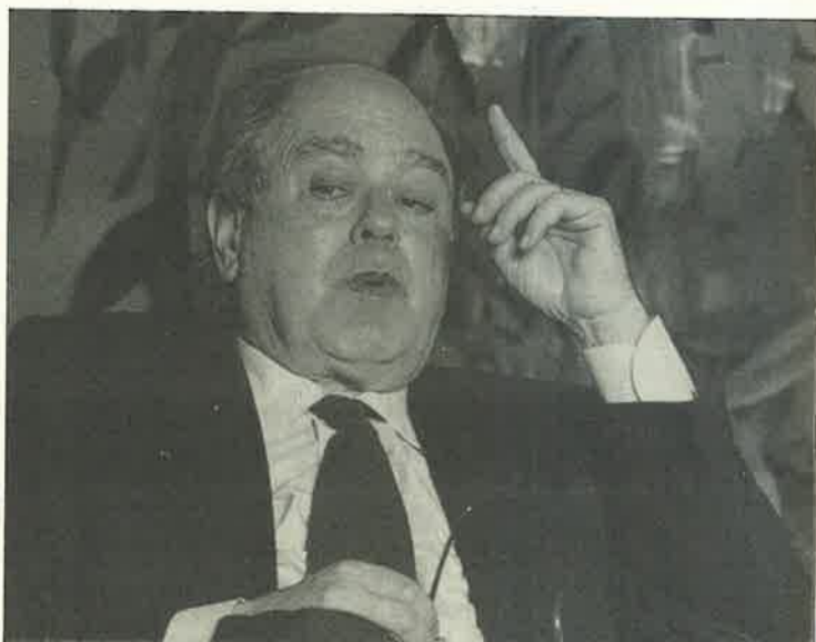
"Menos mal que hemos aprobado los presupuestos, porque si no..."

- Al Departamento de Enseñanzas Básicas de la E.T.S.I. Navales por tener tres asignaturas de primer curso con un índice de aprobados inferior al 10%.