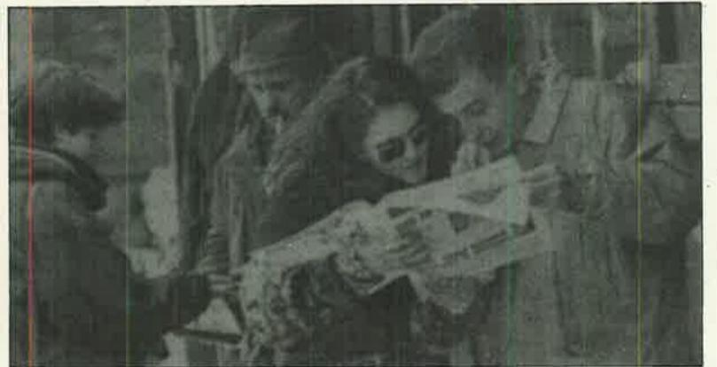
Averigua los plazos para solicitar la compensación en la Secretaría de tu Centro.

Los tribunales de compensación tienen la potestad de compensar la última asignatura de la carrera, teniendo en cuenta el expediente académico del alumno que lo solicita. Para poder pedir la compensación es necesario haberse presentado al menos a dos convocatorias de la asignatura que se pretende compensar, y hay que hacerlo en plazo y forma. El plazo para formular dicha solicitud es de diez días a partir de la publicación de la última nota (que en ocasiones se entiende como la última nota del alumno y en otras como el último acta de la convocatoria; por tanto conviene que os acerquéis a la Secretaría de vuestro Centro a preguntar). En cada Centro existe una Junta de Compensación elegida por la Junta de Escuela o Facultad, que puede conceder la compensación directamente (es decir aprobar la asignatura en cuestión), denegarla o proponer la realización de una prueba extraordinaria. Poco más se puede decir, ya que cada Centro tiene sus muy particulares criterios para conceder o denegar la compensación. Para más información, remitíos a vuestras Delegaciones de Centro o a las Secretarías de Alumnos.