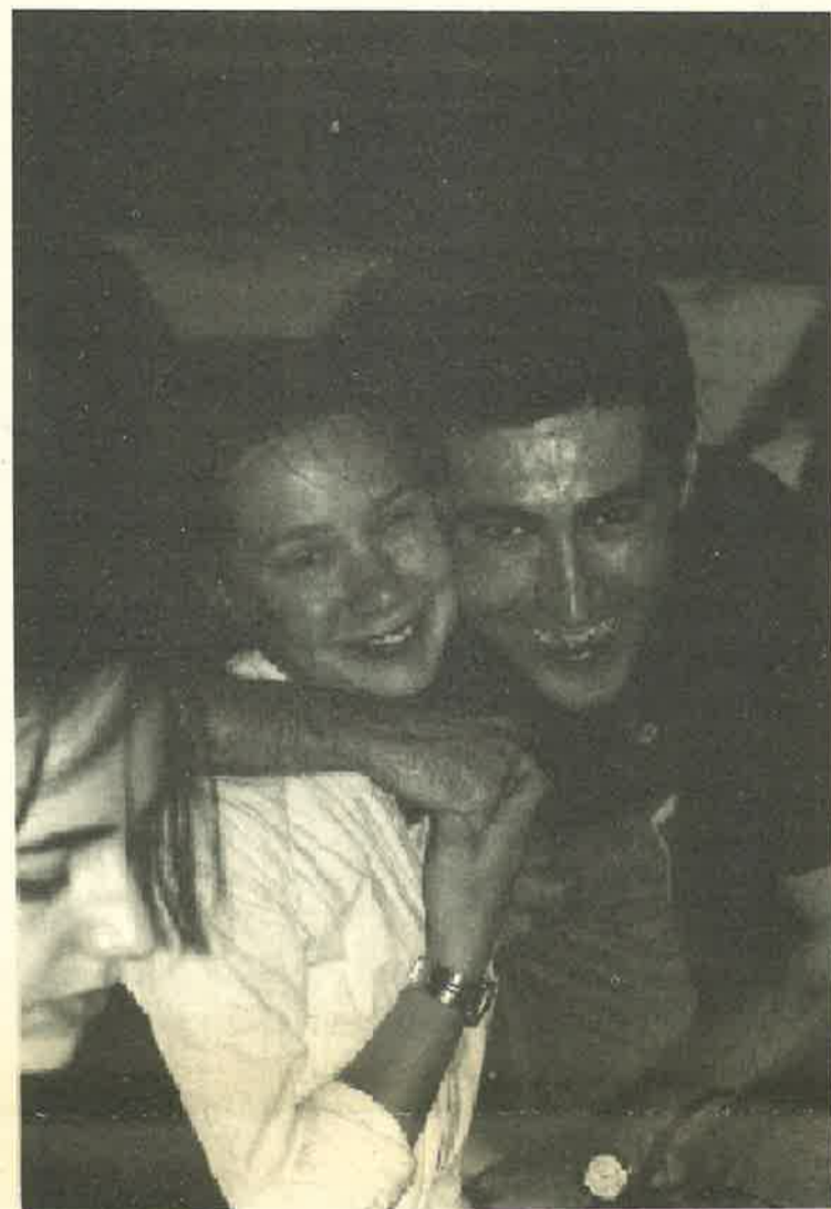
En el Summer Course de B.E.S.T. también se cuidó la componente lúdica