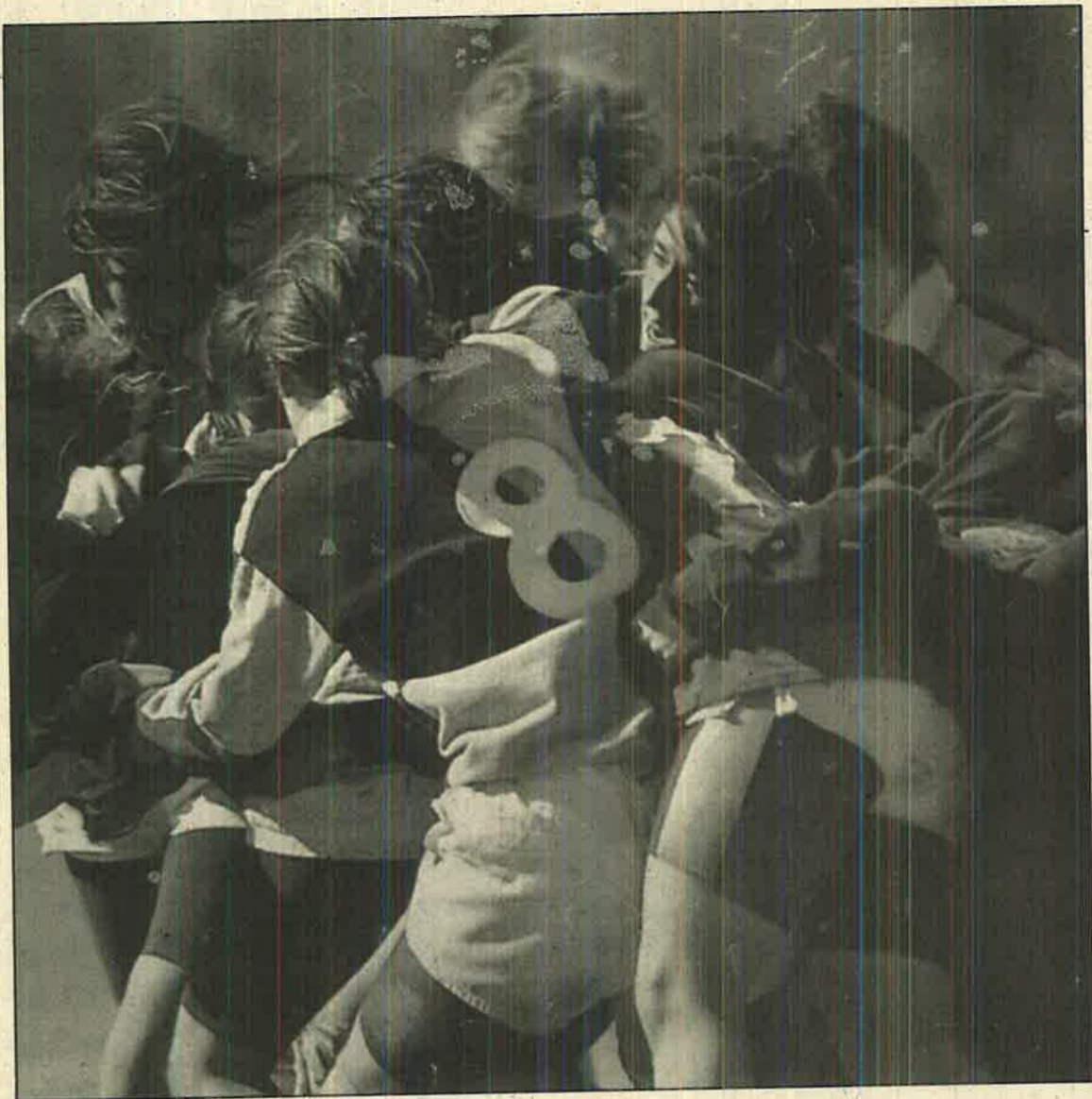
Alumnas de la U.P.M. luchando por un puesto en su Aula de Informática