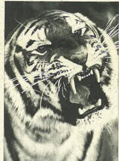
A veces vas a preguntar dudas a un departamento y ...

GABINETE DE PROGRAMAS ESPECIALES ACTIVIDADES CULTURALES AVDA. RAMIRO DE MAEZTU, 7 - DESPACHO B 11