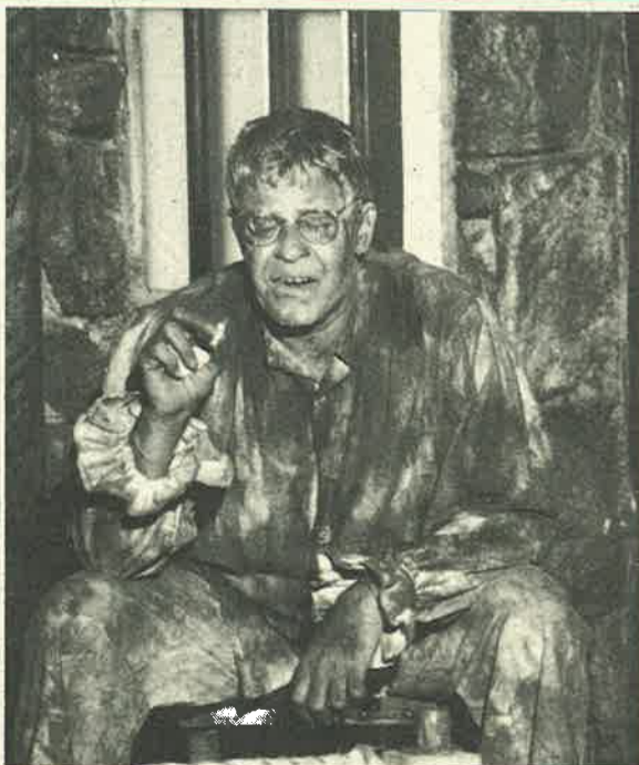
Estado del maquetador de CAMPUS después del n-ésimo cambio