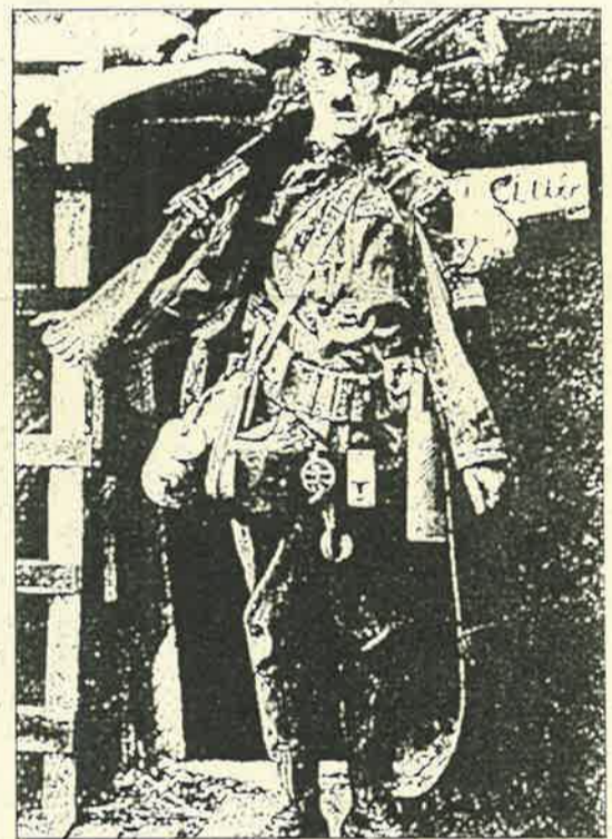
Algunos ya se están viendo de esta guisa

Escuela Universitaria de Arquitectura Técnica de Madrid Avda. Juan de Herrera, 6 - 28040 Madrid Tlf.: 336 75 82