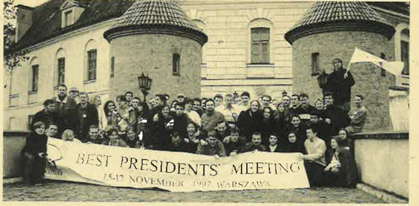
Varsovia, noviembre de 1997, reunión de los máximos responsables en las diferentes universidades miembro de B.E.S.T. Nuestro grupo local de la Delegación de Alumnos U.P.M. es admitido como miembro de pleno derecho.

Estamos alimentando una base de datos (con las precauciones contenidas en el artículo del CAMPUS 106) con todos los que en alguna ocasión han solicitado un curso, para que esta cantidad sólo se ingrese una vez. Es decir, si el año pasado os apuntásteis a los cursos de verano, o este año a los de primavera, no será necesario abonar de nuevo ese dinero para nuevos cursos.