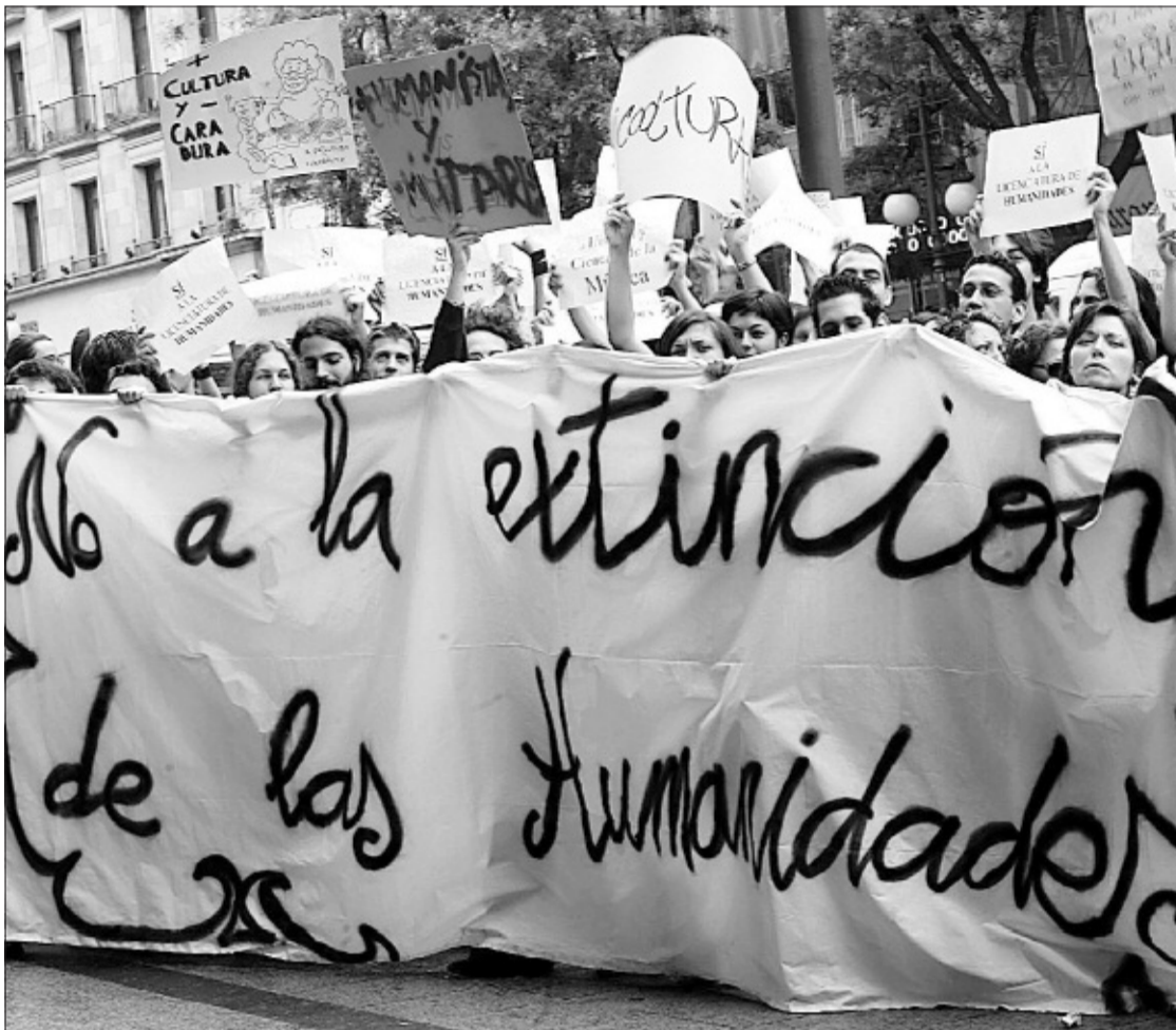
Manifestación de estudiantes de Humanidades esta semana en Madrid.

Pero las primeras conclusiones están ya listas. Aunque es provisional, la propuesta reduce casi a la mitad el catálogo de carreras: de las 140 actuales, a 77. Las subcomisiones de Humanidades y Enseñanzas Técnicas son las que han llevado a cabo las propuestas más drásticas. Una de las sugerencias apunta que Historia del Arte (con 15.321 estudiantes en el curso 2002-2003) quede integrada en la carrera de Historia, como una especialidad. Esta propuesta ha provocado una oleada de reacciones, con manifestaciones y recogida de firmas (más de 35.000 se han entregado en el Ministerio de Educación esta semana) a favor de estos estudios. Gloria, estudiante de 4º de esta carrera en la Complutense, resume el