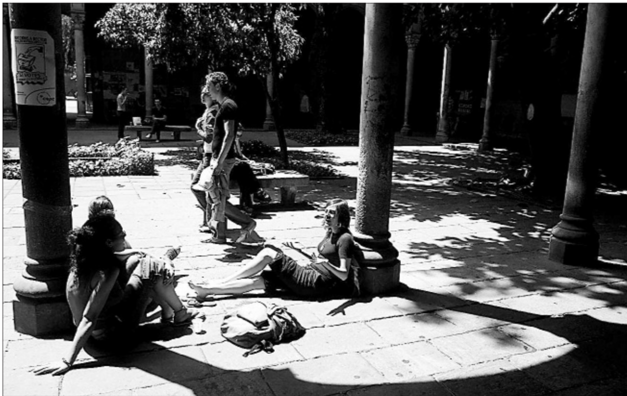
Estudiantes en el claustro de la Facultad de Filología de la Universidad de Barcelona.